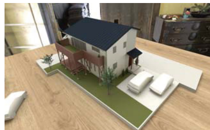
業務では必ずしもこのような表現は必要ではないが、ホームワークで作成しておくことで、表現力の向上や新たなプレゼン手法の発見に繋がる。