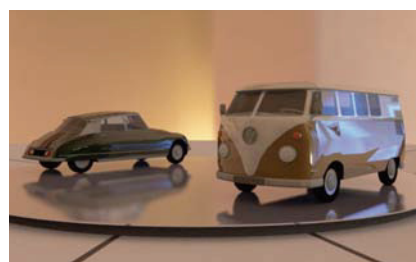
Architect以上をお持ちのユーザーならおなじみのライブラリデータだが、Renderworks2011でレンダリングするとリアルで雰囲気のあるCGが、短時間で作成できる。