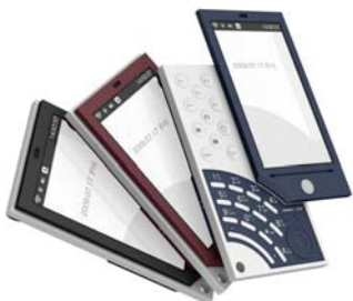
昨今のコンペでは3Dデータの提出は必須だが、書き出し形式の多いVectorworksならそれも問題ない。

レンダリングエンジンが変更になり、短時間でクオリティの高いCGを作成できることが一番の魅力です。今まで敬遠しがちだったムービー取り出しも、食事の合間に書き出すことができます。また、これまでVectorworks2008を使ってきましたが、3Dのスナップも、効率アップに繋がる便利な機能に進化していました。