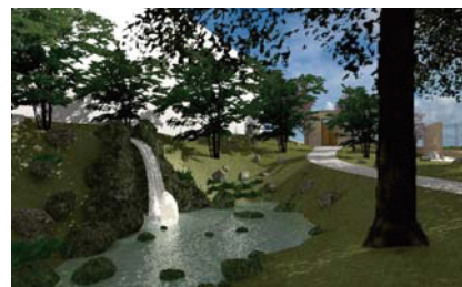
Architect以上に搭載の“地形モデルを作成”コマンドを用いれば、造園のCGも作成できる。現在クロアチアにて進行中。(2011年1月現在)