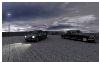
Architect以上のライブラリデータを用いてVectorworks2011をテストした。以前のRenderworksとは趣が異なるレンダリング結果が得られた。