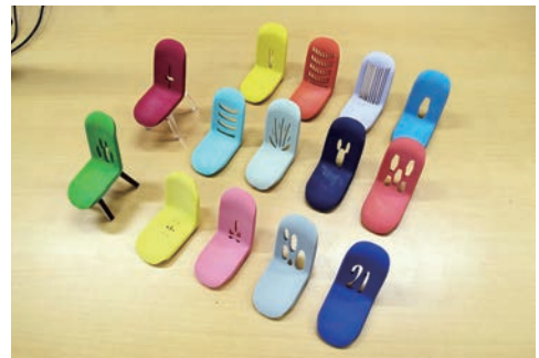
できあがった全14作品。出力時間短縮のため、出力は座面と背もたれ部分だけだったので、脚は後日レーザー加工機で作成した。