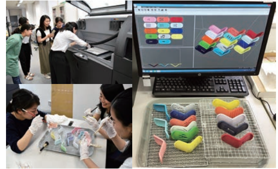
3Dプリンターでのプリントが終わりエアブラシでエアを吹きかける学生(左上)。出てきた作品についた石膏を丁寧に筆で取り除く学生たち(左下)。3Dプリンター出力用のデータと後処理の終わった作品(右)。