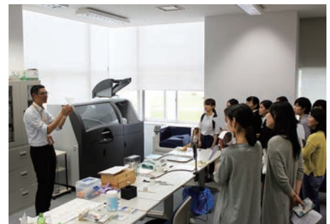
使用する石膏の3Dプリンターの前で熱心に説明を聞く学生たち。