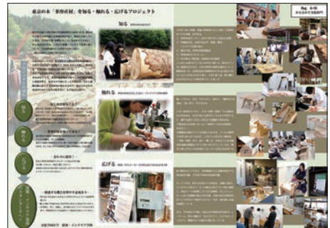
これまでの活動を2014年度の林野庁補助事業「木を活かす学生課題コンペ」に「東京の木“多摩産材”を知る・触れる・広げるプロジェクト」として応募し「地域活動賞」を受賞。