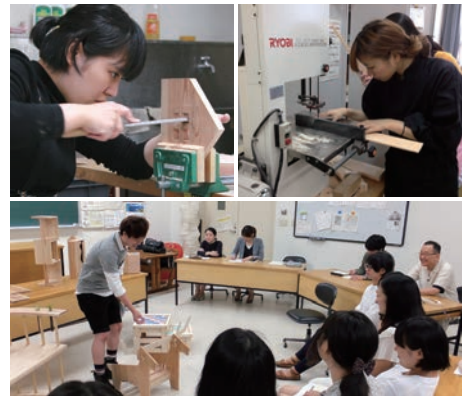
制作風景(左上:2014年度、右上:2013年度)と連携先との授業講評会風景(下:2014年度)。講評会ではコンセプトと材料の生かし方をピーアール。