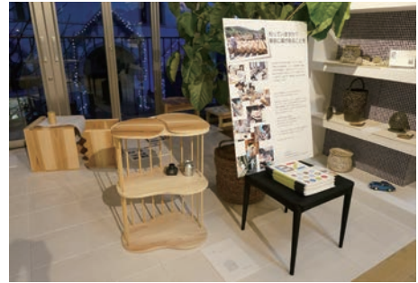
連携先ショールームにおける2014年度制作作品の展示会風景。多摩産材ピーアールと連動した企画。