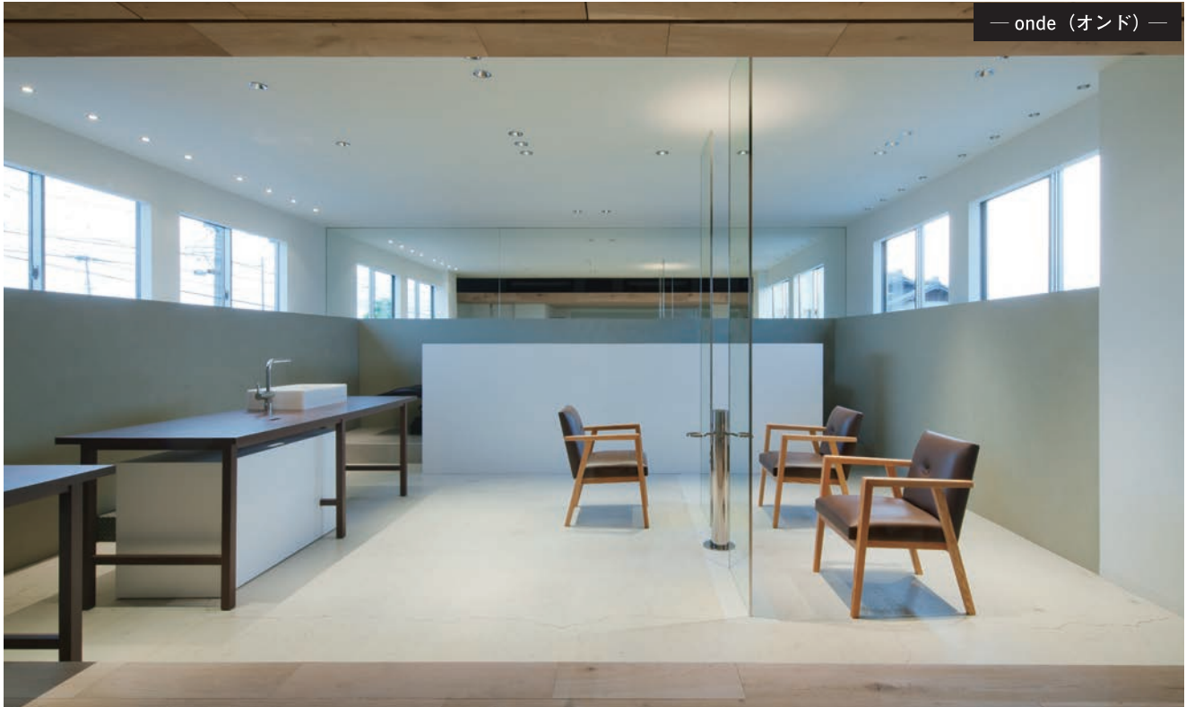
— onde (オンド) —

建築・インテリア設計で高いシェアを持つ2D/3D汎用CADソフト「Vectorworks(ベクターワークス)」。優れた拡張性を備え、多彩な機能を持つ同ソフトは、店舗・インテリア設計の現場ではどのように生かされているのだろうか。