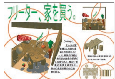
建築CAD後期の創作課題。「ものがたりの登場人物に捧げる家具と空間」作品。