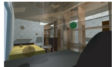
2年生の課題「マイルーム」の空間と家具をVectorworksで仕上げた作品。